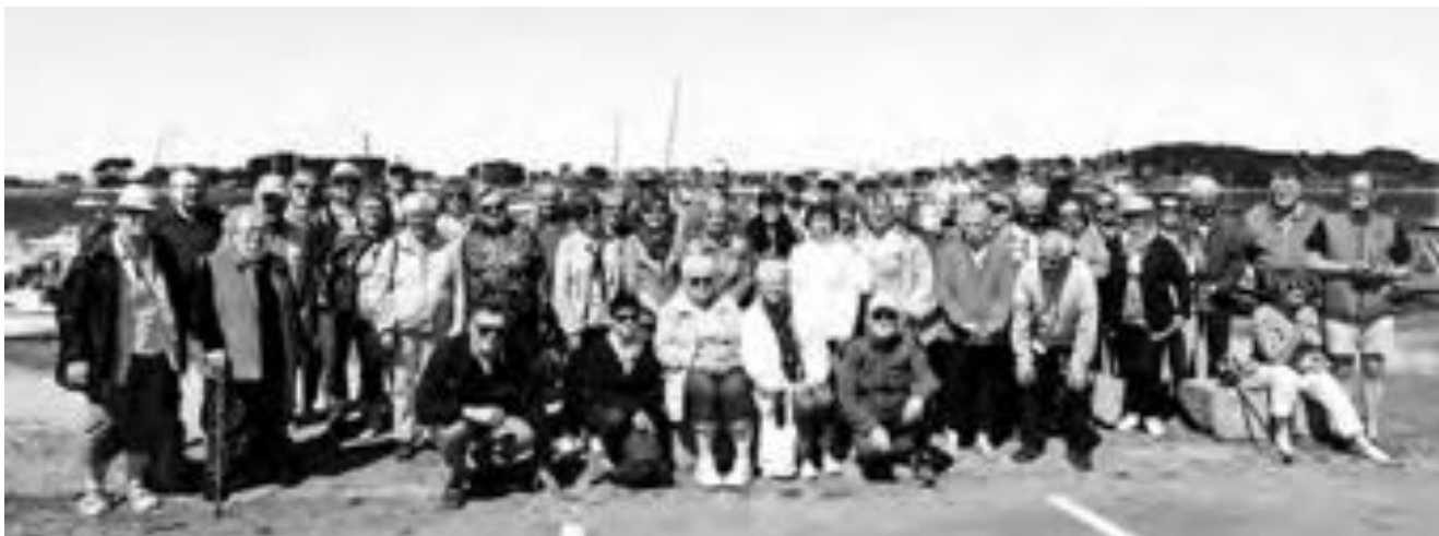
La sortie du mardi 14 juin dans les Abers

Les activités de l'Association sont suspendues du 30 juin au 1er septembre 2022.