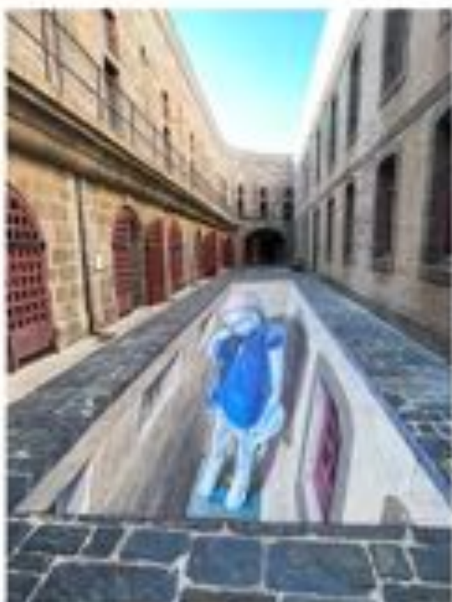
LEON KEER Fresque présente au Chateau du Taureau (Morlaix Arts Tour)