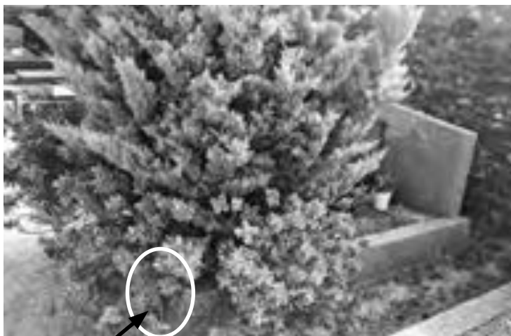
L'enracinement des arbustes a pour effet de déstabiliser le monument et les tombes

A noter dans un des articles, il a été mentionné l'interdiction de planter des arbustes sur les concessions car l'enracinement a pour effet de déstabiliser le monument et les tombes voisines (voir photo). Des courriers vont être envoyés aux locataires des concessions concernées, après passage de la commission cimetière.