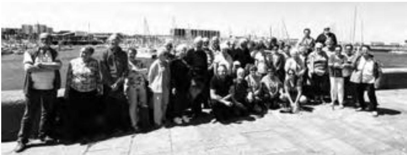
Visite du sous-marin nucléaire « le redoutable »