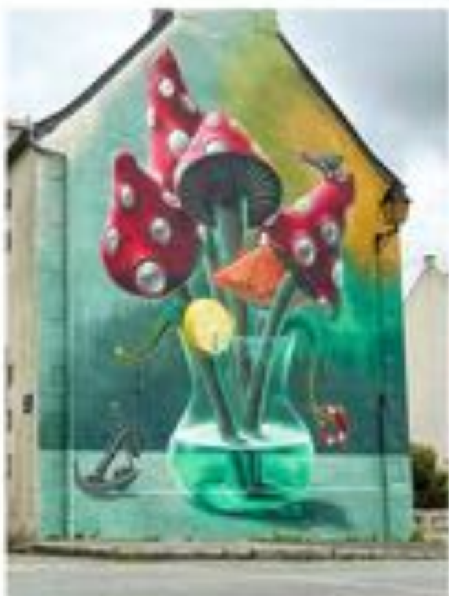
WOLKERSKI Fresque présente au bourg (Morlaix Arts Tour)