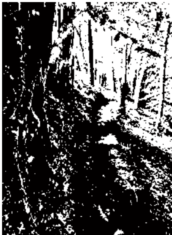
Passages de la nouvelle boucle au Corniou